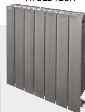
ATOLL TECH TAXT FINITION TECHNOLINE (Page 240)