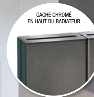
CACHE CHROMÉ EN HAUT DU RADIATEUR